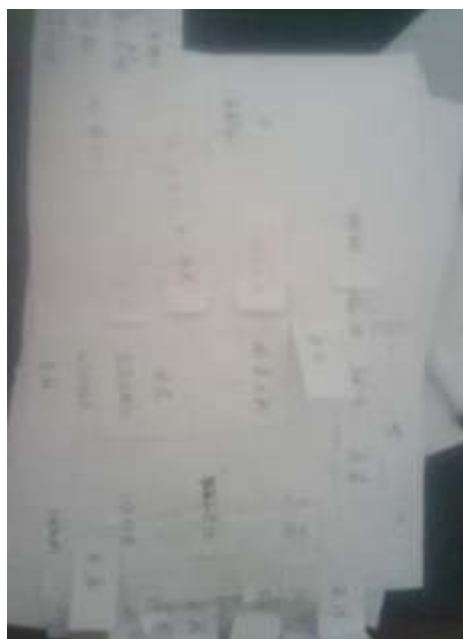
图 16：与会者的编码 2