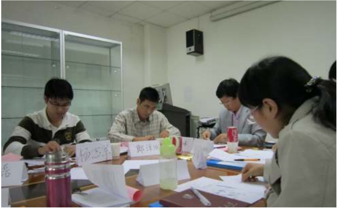
图 9：与会者在进行编码