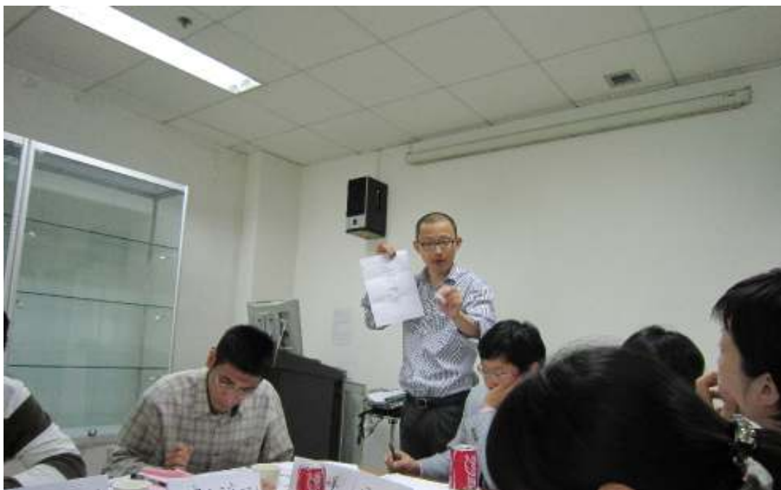
图 13：费博士在现场点评