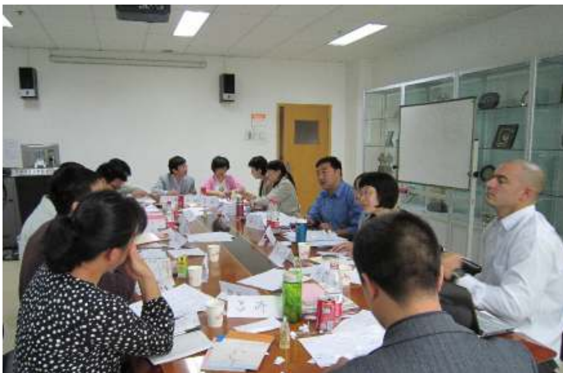
图 11：与会者介绍自己的编码过程及结果

候似乎更贴切一些，也许要做好扎根理论的编码工作就应该了解社会学的很多术语。介绍和讨论现场图片如下：