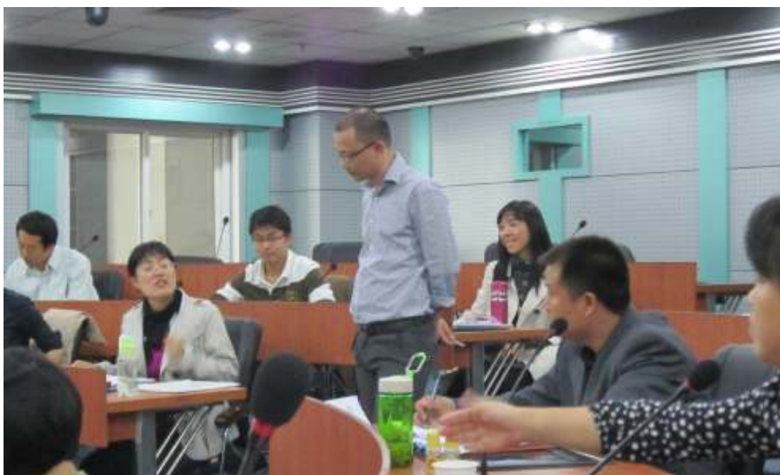
图 14：下午换了地方继续介绍和讨论

虽然在资料的转录和编码的过程中编码者难以避免加入个人的主观意见，但是令人惊奇的是，很多概念重复地在不同参与者的编码中涌现出来。一开始接触扎根理论的时候，总是觉得这种方法主观性太强了，不同的人带着自己的认识论和本体论来看待同一个事件，可想而知，每一个人所看到的和关注的东西肯定不一样，主观性的影响对于最后研究结果的影响难以避免，但是经过这样一个编码练习，我发现主观性的影响虽然难