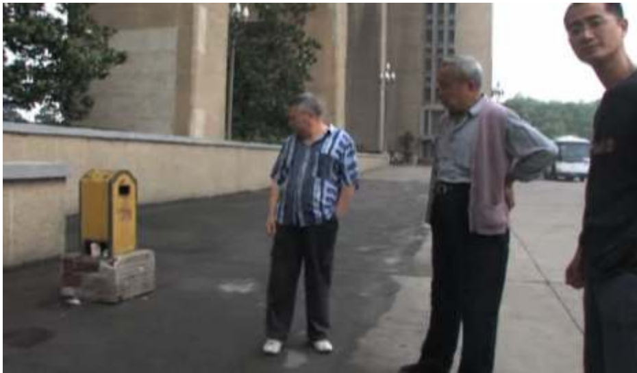
图 2：有人在南京长江大桥自杀后的一幕