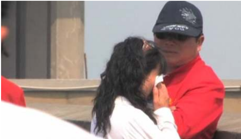
图 4：劝说想要自杀的人