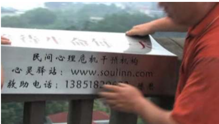
图 6：大桥上贴救助广告